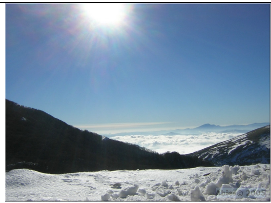
Monte Kronio – Cammarata

All'interno della riserva attualmente non è prevista nuova edilizia, si tratta di un'area abbastanza piccola, circa 760 ettari, autorizzare nuova edilizia significherebbe modificare in modo irreversibile il particolare e straordinario paesaggio naturale ed antropico della riserva naturale di Torre Salsa. La conservazione dell'attuale paesaggio, anzi il suo potenziamento in termini di aumento della sua integrità attraverso l'eliminazione di alcuni gravi elementi di disturbo potranno offrire un bene culturale di livello che possa attrarre un turismo sostenibile e di qualità e destagionalizzato capace di dare opportunità di sviluppo ai servizi di ristorazione e di ospitalità che negli ultimi anni si stanno sviluppando all'esterno della riserva nel territorio circostante.