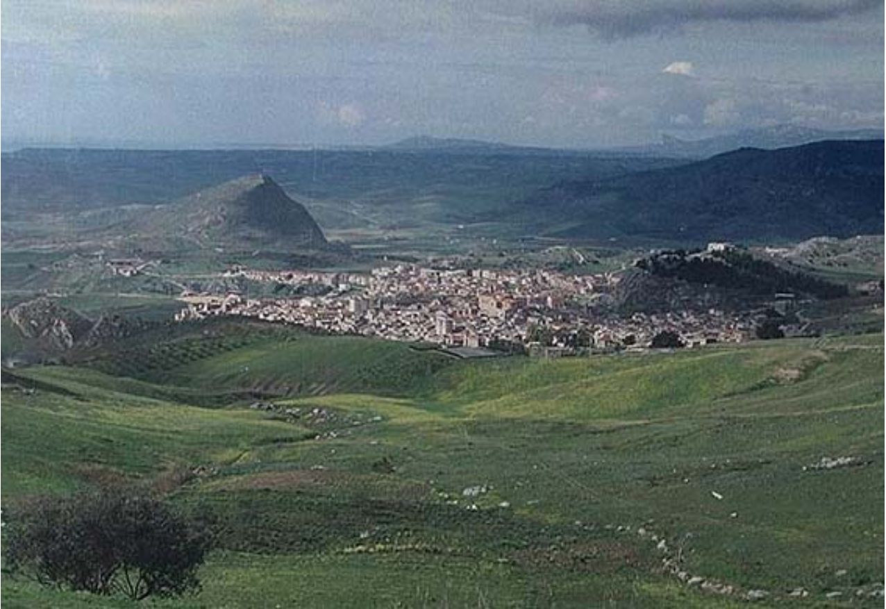
Veduta di Cattolica Eraclea