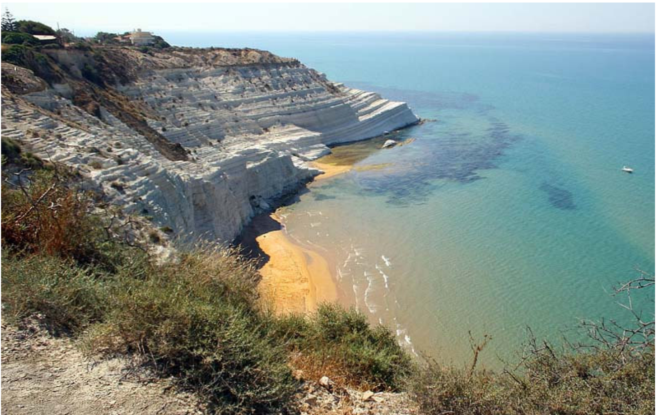
Scala dei Turchi – Realmonte

Nata dalla contrapposizione di una ipotesi di realizzazione di Comprensorio turistico dal comune di Siculiana il piano che prevedeva la realizzazione di un complesso turistico alberghiero per circa 10.000 posti letto. Era stato previsto anche una darsena, con una capienza di 700 posti barca, la costruzione di un campo da golf. Il Consiglio Regionale Urbanistico (C.R.U.) boccia il progetto per le particolari pregevolezze ambientali da salvaguardare. La riserva viene istituita e regolamentata con D.A. 273/44 del 23 giugno 2000 e ne viene affidata la gestione al WWF.