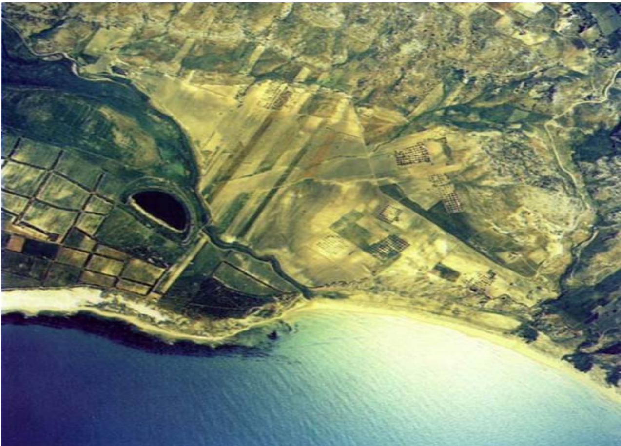
Veduta dal satellite della riserva di Torre Salsa

La Riserva Naturale Orientata "Torre Salsa" (Siciliana, Agrigento) è stata istituita nel giugno del 2000 dalla Regione Siciliana e si estende per circa 740,00 ettari divisi in 364,00 ha di zona di riserva e 376,00 ha di zona di pre-riserva.